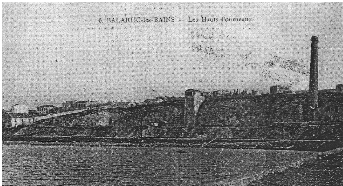
Photocopie d'une carte postale déposée, à la bibliothèque de Balaruc-les-Bains. Ce paysage disparut très vite laissant une excavation dans la falaise, aujourd'hui comblée par un ensemble immobilier.

Le Conseil approuvera la substitution. »